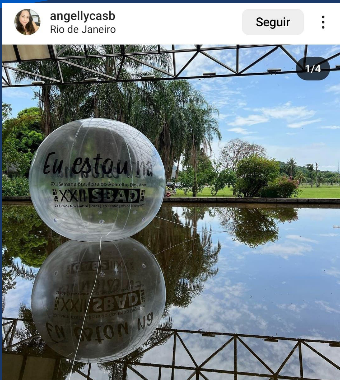
Imagem da edição