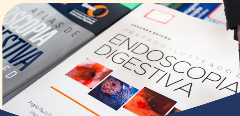
Lançamentos da SOBED na SBAD